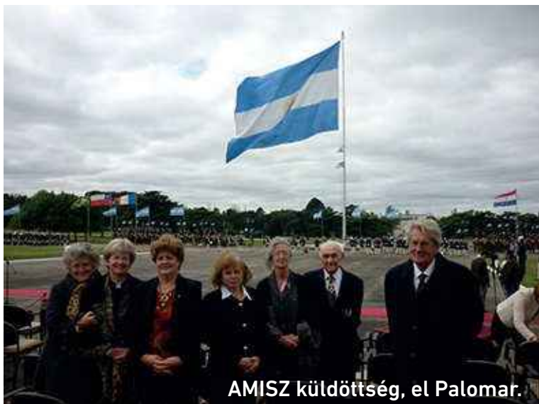
AMISZ küldöttség, el Palomar.

országok határát Argentínával. 1904-ben, 82 éves korában halt meg. Élete utolsó napjáig vágyódott haza Háromszék megyébe a Székelyföldre. Az 1867-es kiegyezés után a század végén, a magyar kormány magas kitüntetéssel és nyugdíjjal hívta vissza, de öregségére erre már nem szánta rá magát. Egy csodálatos irodalmi magyar nyelven, kézzel írt levélben mondott le a meghívásról.